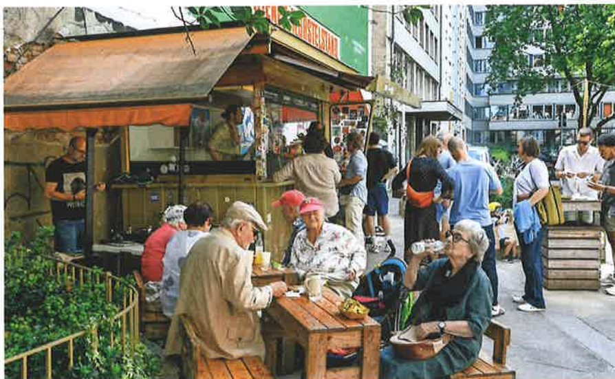
Gut leben mit Demenz – der Verein PROMENZ unterstützt.